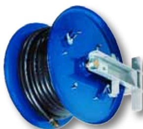
automatischer Schlauchaufroller mit allseitiger Rollenführung, sicherer Arretierung, auch mit schwenkbarer Wandhalterung und Schutzhaube