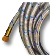
Schlauch mit Sicherheitsummantelung