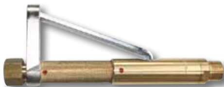
Hebelventil zur sofortigen Unterbrechung der Gaszufuhr durch Loslassen