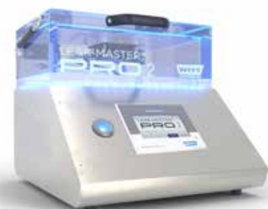
Medición en curso