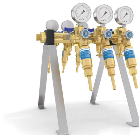
avec 4 ou 6 points de sortie Universal V6