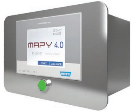
MAPY 플러그인 모듈