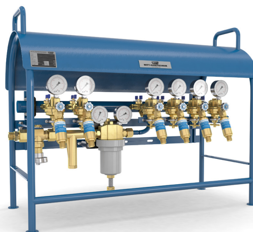
Для 4 или 6 сварочных постов